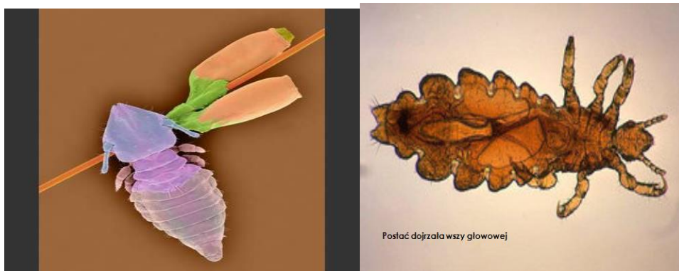
Postać dojrzała wszy głowowej z jajeczkami przyczepionymi do włosa