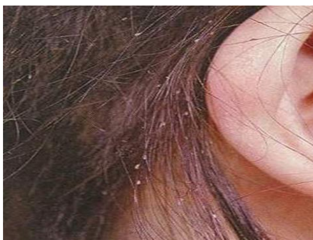
Jajeczka złożone przez wesz głowową przyczepione do włosów.